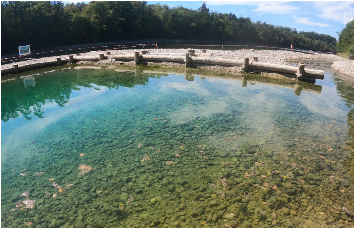
Kaltwasserbereich im Hochrhein während des Sommers 2022.