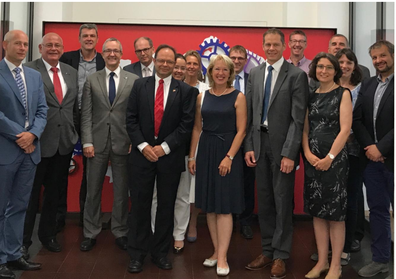
1 ère assemblée plénière de la CFP, après la fusion des Conférences des Directeurs des forêts et des Directeurs de la chasse (juin 2017)